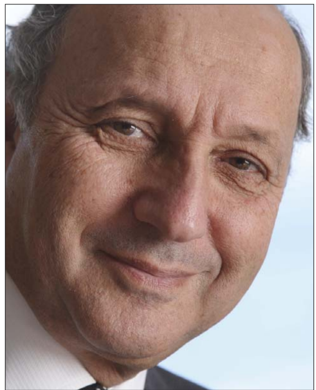
Pour Laurent Fabius, ce forum est utile parce que « Nous avons besoin de tous les outils pour lutter contre le chômage. »

Oui. Le contexte économique et social national reste difficile, la crise est toujours là. Nous avons besoin de tous les outils pour lutter contre le chômage. C'est pourquoi la CREA soutient cette initiative utile.