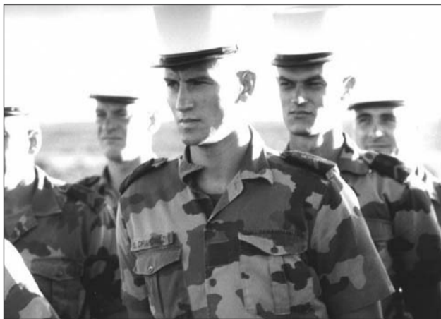
Envie de dépaysement ? La Légion recrute de 17 à 40 ans.

Ils sont artisans, chefs d'entreprise, militaires ou simples salariés et parlent sans détour de leur quotidien. Petit tour d'horizon des métiers qui recrutent à Rouen.