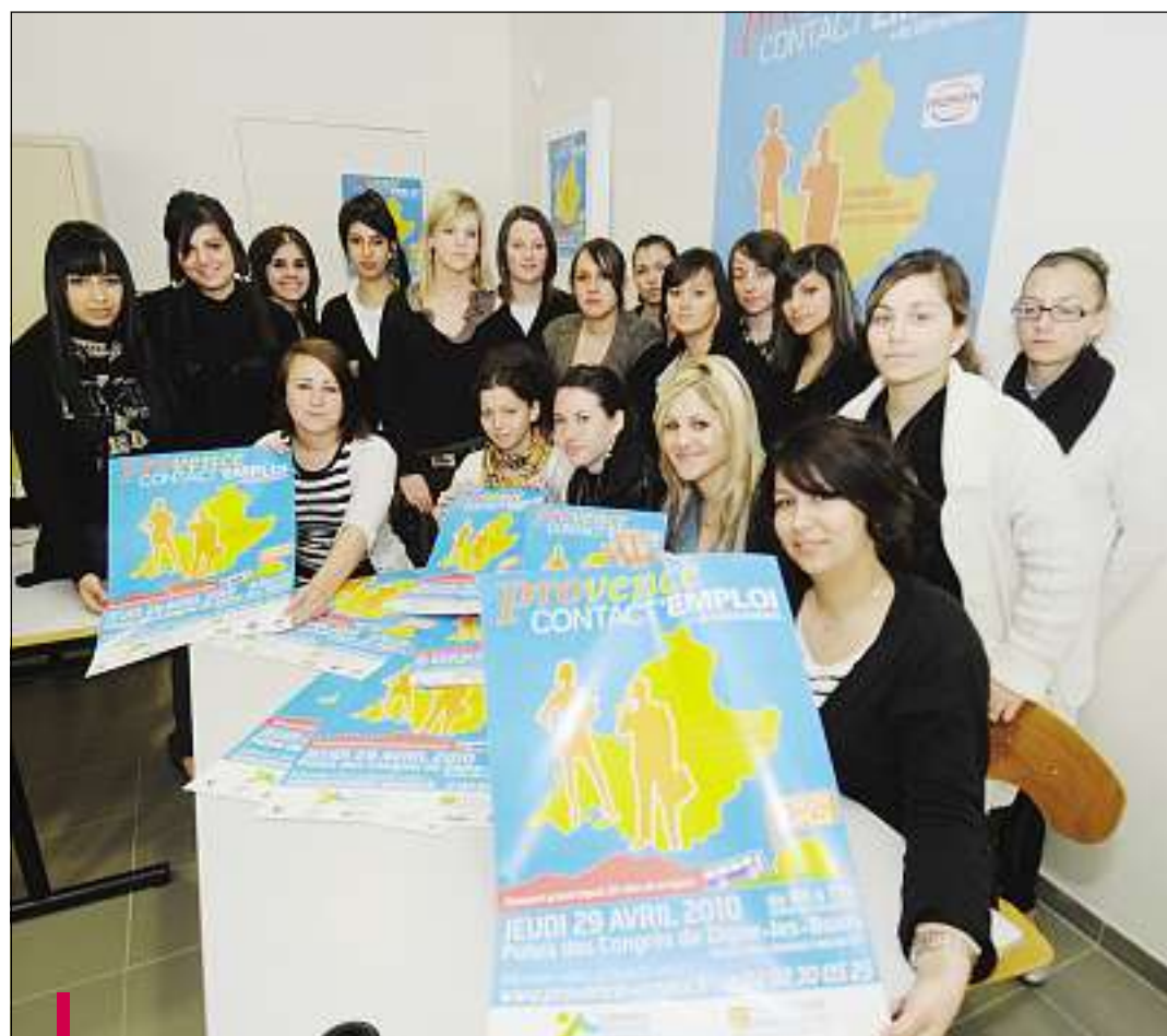
Le forum Provence Contact'Emploi, présentée par des élèves du lycée Beau de Rochas dans les Alpes-de-Haute-Provence, verra la participation de 120 entreprises et collectivités.

Qu'à cela ne tienne: le cru 2010 du forum sera comparable à celui de l'an passé par le nombre des participants. "En revanche, il y a des variations dans les familles de métiers. Le nombre des offres proposées dans le secteur du commerce et de la distribution a été doublé. Alors que le nombre de celles proposées dans le bâtiment et les travaux publics a été divisé par deux. C'est la même chose pour les banques