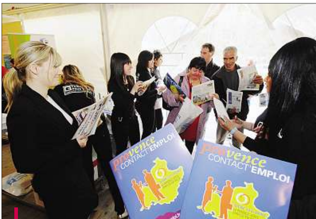
Le forum de l'emploi de Digne peut être l'occasion de débiter une carrière dans le secteur professionnel de votre choix. Les recruteurs viennent pour trouver des candidats.

► S'ORIENTER. Le site donne aux visiteurs la possibilité de télécharger un guide-outil comportant un plan du forum et un index complet de tous les exposants classés par ordre alphabétique. Le tout assorti à chaque fois d'une fiche signalétique et