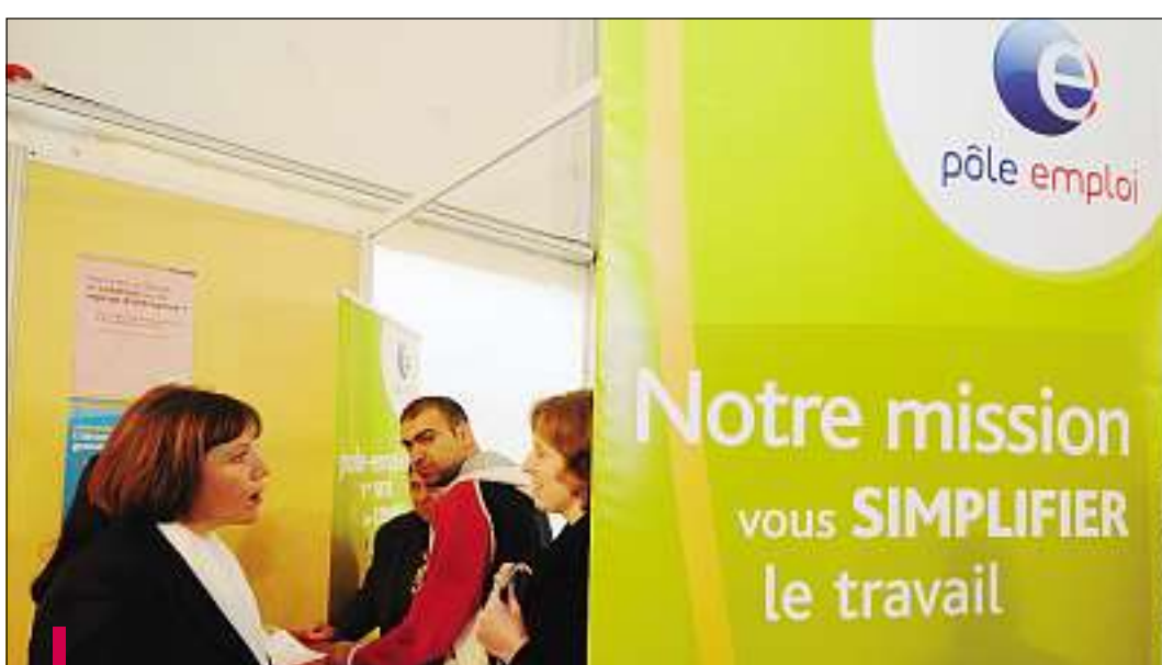
Pôle Emploi est un partenaire précieux du salon Contact'Emploi. Le service public de l'emploi prévient notamment par SMS ceux dont les compétences sont compatibles avec les offres.

tous les mois par les différents employeurs. Pole-emploi.fr, ce sont également des informations sur les divers services de l'organisme, les métiers, les aides à l'embauche, les mesu-