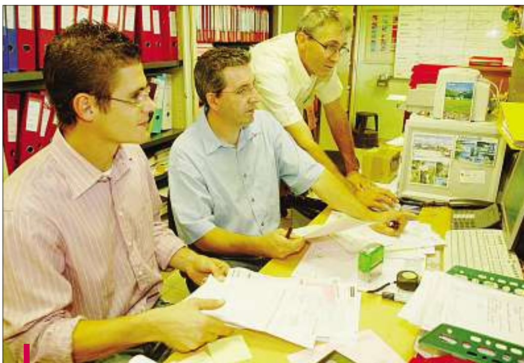
L'entreprise Cuisine et Froid d'Entraigues a recruté des personnes souffrant d'un handicap. Le forum de Digne souhaite intensifier cette pratique en proposant un stand et une table ronde.

Pour les organisateurs, il était exclu de ne pas ouvrir ce carrefour de l'emploi aux travailleurs en situation de handicap. Un stand d'information et d'orientation leur sera destiné et une table ronde qui réunira divers partenaires tels l'AGEFIPH (Association de gestion du fonds pour l'insertion professionnelle des personnes handicapées), le réseau Cap Emploi, la MDPH (Maison Départementale pour le Handicap), l'Union des entreprises ou encore Pôle Emploi, débutera à 11 h 45. Les lois de juillet 1987 et février 2005 sur l'égalité des chances font obligation aux entreprises de plus de 20 salariés d'avoir un quota de